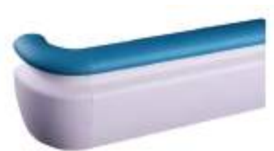
● Color Sólido Azul