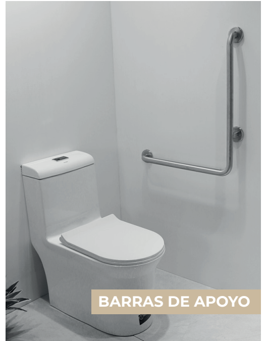
BARRAS DE APOYO